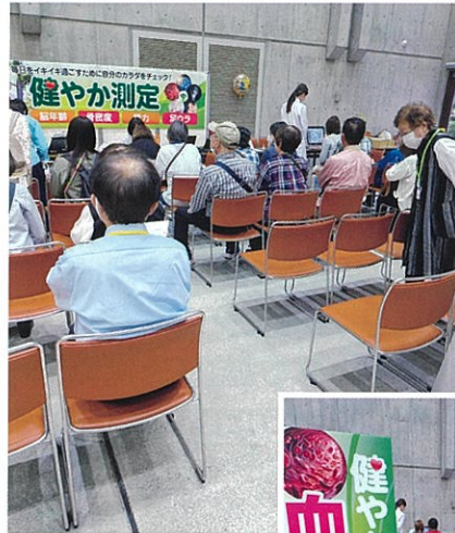
当日のブースの様子

最終的には1日目・2日目で3測定のべ800名以上の方が測定をお受けになり、イベント参加型の測定会では過去最高の人数となりました。今後も参加された方が健康づくりを気軽に楽しくできるよう努めたいと思います。