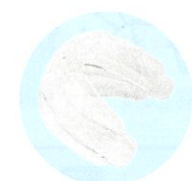
▲ナイトガード(歯ぎしり用マウスピース)