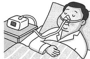
※CPAPの自己負担は月4,000円程度。

軽度の場合はマウスピースで就寝時の気道を広げますが、中等症以上ではCPAPを使って圧力をかけた空気を鼻から送り込み、気道が狭くなるのを防ぎます。体質的に気道が狭い人は手術を行う場合もあります。