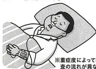
※重症度によって検査の流れが異なる場合があります。

まずは自宅での就寝時にパルスオキシメータなどの機器をつけ、血液中の酸素飽和度を調べる簡易検査を行います。その結果に応じて、1泊入院して精密検査(終夜睡眠ポリグラフ検査)を行い、脳波や眠りの質を詳しく調べて診断します。