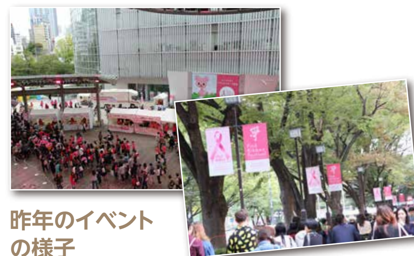
昨年のイベントの様子